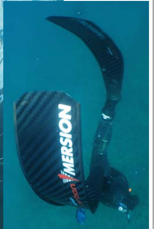
La souplesse est au rendez-vous.

Les spécialistes de l'apnée dynamique et les mordus de chasse profonde apprécieront la Freediving Spirit. Mais, notre essai le révèle, cette palme conviendra aussi à ceux qui aiment les sorties sans souci dans des profondeurs... de tous les jours. +