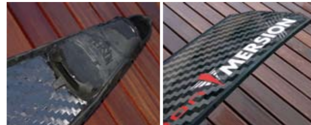
Le chausson, déjà connu, s'adapte parfaitement au caractère de la nouvelle voilure. Des guides latéraux assez hauts.

En piscine, le niveau de performances apparaît très vite. Dès la mise à l'eau, on est surpris par une souplesse incroyable. La propulsion est exemplai-